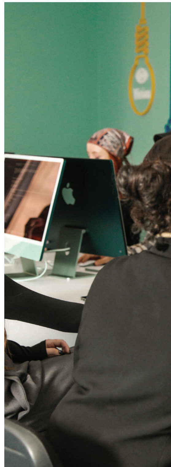
ადგილი დაიკავა. აღნიშნული წარმატება უნივერსიტეტს სწორედ სტუდენტებმა და მათ მიერ შექმნილმა პროექტებმა მოუტანა, რომლებიც სტაბილურად იმარჯვებენ სხვადასხვა კონკურსში.

2024 წლის დასაწყისში „საქართველოს უნივერსიტეტის“ არქიტექტურის დეპარტამენტმა მსოფლიოში 39-ე, ხოლო აზიაში მე-2